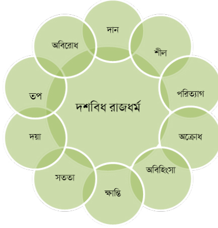
চিত্র ৩: দশবিধ রাজধর্মের বৈশিষ্ট্য

নৈয়ায়িক সমাজ ও সুশাসন প্রতিষ্ঠার হাতিয়ার হিসেবে বুদ্ধ যে দশবিধ রাজধর্মের কথা বলেন তা শাসন ব্যবস্থায় আজও খুবই অপরিহার্য বলে মনে করা হয়। গণতান্ত্রিক শাসনব্যবস্থায় যদি উপরি-উক্ত দশবিধ রাজধর্ম অনুসৃত হয় তবে সমাজ ও রাষ্ট্রীয় জীবনের সর্বত্র কল্যাণ বিরাজ করার পাশাপাশি বৈষম্যহীন সমাজ ও ন্যায়বিচার প্রতিষ্ঠা হবে এবং মানবাধিকারের লঙ্ঘন হবে না।