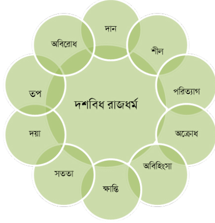
চিত্র ৩: দশবিধ রাজধর্মের বৈশিষ্ট্য

নৈয়ায়িক সমাজ ও সুশাসন প্রতিষ্ঠার হাতিয়ার হিসেবে বুদ্ধ যে দশবিধ রাজধর্মের কথা বলেন তা শাসন ব্যবস্থায় আজও খুবই অপরিহার্য বলে মনে করা হয়। গণতান্ত্রিক শাসনব্যবস্থায় যদি উপরি-উক্ত দশবিধ রাজধর্ম অনুসৃত হয় তবে সমাজ ও রাষ্ট্রীয় জীবনের সর্বত্র কল্যাণ বিবাজ করার পাশাপাশি বৈষম্যহীন সমাজ ও ন্যায়বিচার প্রতিষ্ঠা হবে এবং মানবাধিকারের লক্ষ্যন হবে না।