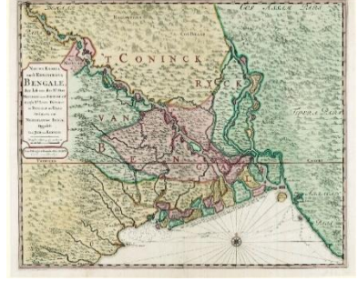
মানচিত্র: ৪; ভ্যান ডেন ব্রুক মানচিত্র (১৭২৬)

মানচিত্রগুলোতে ভৌগোলিক অবস্থার এরূপ বৈচিত্র্যের একাধিক কারণ থাকতে পারে। একটা সুস্পষ্ট কারণ হচ্ছে জমির ভাঙাগড়া, যা এই বর্ষাপ্রবণ ও পলিমাটি গঠিত অঞ্চলের আদি বৈশিষ্ট্য। মানচিত্রগুলোর এই ধরনের ‘অসঙ্গতির’ আরেকটা কারণ হচ্ছে নদীর গতিপথ ও সামগ্রিক নদী ব্যবস্থার ক্রমপরিবর্তনশীলতা এবং নদীপথ ও পলিমাটির ভাঙাগড়ার চক্রের মধ্য দিয়ে দ্বীপ গড়ে ওঠা ও বিলীন হয়ে যাওয়ার অবিরত প্রক্রিয়া; তাছাড়া সতেরো শতকে সমুদ্রতীর সংলগ্ন বদ্বীপ অঞ্চলে অনেক পরিবর্তনও ঘটেছিল (অনিল, ২০১৯, পৃ. ৯-১০; অতুল, ২০০৮, পৃ. ৩৩-৩৯)। এর ফলে প্রত্যক্ষ ও পরোক্ষ তথ্য-উপাত্তের সংমিশ্রণের ওপর ভিত্তি করে তৈরি করা মানচিত্রগুলোতে বিভিন্ন ধরনের ভৌগোলিক অবস্থা দেখা যায়। আরেকটা কারণ হতে পারে, বঙ্গীয় বদ্বীপের সূক্ষ্ম, দুরুহ ও ক্রমপরিবর্তনশীল নদীব্যবস্থাকে পুঙ্খানুপুঙ্খভাবে তুলে ধরা প্রাচীন বা মধ্যযুগের মানচিত্রাঙ্কন জ্ঞান ও প্রযুক্তির পক্ষে সম্ভব ছিল না।