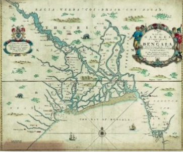
মানচিত্র: ৩; থর্নটন মানচিত্র (১৬৮০)