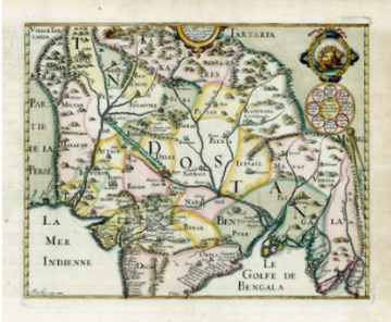
মানচিত্র: ১; ব্যাফিন রো মানচিত্র (১৬১৯)

অঞ্চলের একটা বড় অংশ এখনও গঠিত হচ্ছে, সেখানে প্রাচীনযুগে বা মধ্যযুগেও ভূপ্রাকৃতিক অবস্থা অনেকটাই আলাদা ছিল তা সহজেই অনুমান করা যায়। 'বাংলা' বা 'পূর্ববঙ্গ' বলতে আমরা এখন যা বুঝি তা সবসময় একটা সমন্বিত ও একক ভূখণ্ড ছিল, এমনটা মনে করাও হবে অমৌজিক। বদ্বীপ গঠিত হয় ক্রমান্বয়ে এবং সুদীর্ঘকাল ধরে। প্রাগৈতিহাসিক কালে এই অঞ্চলের ভূগোল কেমন ছিল তা এখন আর সুচারুভাবে জানা সম্ভব নয়। তবে ইউরোপীয় প্রশাসক, বণিক ও মানচিত্রকরেরা বাংলা অঞ্চলকে বিভিন্ন সময়ে যেভাবে উপস্থাপন করেছেন, তা থেকে আমরা কিছু খণ্ডিত চিত্র খুঁজে পাই। ১৬১৯ সালের ব্যাফিন-রো মানচিত্র, ১৬৫৭ সালে অঙ্কিত নিকোলাস স্যানসনের মানচিত্র, ইস্ট ইন্ডিয়া কোম্পানির ১৬৮০ সালের থর্নটন মানচিত্র, ১৭২৬ সালের ম্যাথিউস ভ্যান ডেন ব্রুকের তত্ত্বাবধানে তৈরি করা মানচিত্র— সবগুলোর মধ্যে নানা পার্থক্য থাকলেও এটা স্পষ্ট যে, এই অঞ্চলে একটি সংগঠিত ও 'পূর্ণ' ভূখণ্ড তৈরি হয়েছে শত শত বছর ধরে নদীবাহিত পলিমাটি জমা হওয়ার মধ্য দিয়ে। মানচিত্রগুলোতে বাংলা অঞ্চল উপস্থাপিত হয়েছে দ্বীপপুঞ্জের মতো করে। বাংলা হয়তো কখনও দ্বীপপুঞ্জ ছিল না, কিন্তু বৃহদাকার নদী ও সুবিস্তৃত, জটিল নদীব্যবস্থা, চরাঞ্চল ও জলাভূমি সুনিশ্চিতভাবেই বাংলাকে করে রেখেছিল একটি দুর্গম অঞ্চল; যা প্রাচীন ও মধ্যযুগের সাম্রাজ্যগুলোর সেনাবাহিনীর জন্য ছিল অনধিগম্য ও প্রশাসনের জন্য তৈরি করেছিল শাসনের অযোগ্য একটি জনগোষ্ঠী।