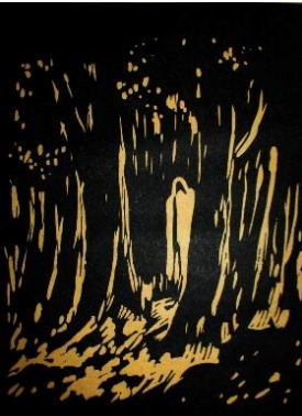
চিত্র ১: জয়নুল আবেদিন, বিচিত্রতা , কাঠখোদাই, ১৯৩৭

জয়নুল আবেদিন বাংলাদেশের আধুনিক শিল্পান্দোলনের পথিকৃৎদের অন্যতম। বলা যায় কুসংস্কারাচ্ছন্ন, গোঁড়া ধর্মীয় এবং সাংস্কৃতিক কর্মকাণ্ডশূন্য একটি সমাজে তাঁর হাত ধরেই আধুনিক শিল্পযাত্রার সূচনা। তিনি ১৯১৪ খ্রিস্টাব্দের ২৯ ডিসেম্বর তৎকালীন ময়মনসিংহ জেলার কিশোরগঞ্জ মহকুমার কেন্দুয়াতে (বর্তমান নেত্রকোনা) জন্মগ্রহণ করেন। ছোটবেলা থেকেই তাঁর শিল্পকলার প্রতি গভীর অনুরাগ ছিল। তিনি কলকাতা গভর্নমেন্ট স্কুল অব আর্টস-এ শিল্পশিক্ষা (১৯৩৮) গ্রহণ করেন।