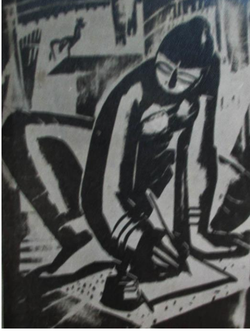
চিত্র ৪: কামরুল হাসান, বসে থাকা রমণী, লিথোগ্রাফ, ১৯৫২