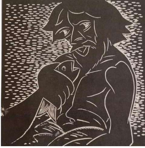
চিত্র ৫: কামরুল হাসান, মৎস-স্বপ্ন, লিনোখোদাই, ১৯৭৪

রূপকল্প-৭৪ শীর্ষক সিরিজের একটি ছবিতে পুরোটা জুড়ে এক ধূর্ত লোলুপ শিয়ালের উপস্থিতি। শিয়ালের পায়ের নিচে একটি সাপ ফণা উঁচু করে আছে। ফণার ওপরে একটি মা-পাখির পিঠে বসে আছে ক্ষুধায় মুখ হাঁ করে থাকা দুটি পাখির বাচ্চা। শিয়ালের কানে বসে থাকা আরও একটি পাখির পেছন দিয়ে সন্তর্পণে উঠে আসছে একটি হিংস্র কুমির। বাম দিকের নিচের কোণায় একটি শকুন এগিয়ে যাচ্ছে গরুর দিকে। উপরের দিকে হিংস্র বাদুড় ছুটে যাচ্ছে একটি নিরীহ কবুতরের পানে। স্বাধীনতাত্ত্বের দেশে শান্তি এবং মূল্যবোধকে নির্বাসনে পাঠিয়ে দুর্নীতিগ্রস্ত, সুযোগসন্ধানী আর ক্ষমতাবানদের দৌরাত্যাকে এখানে শিল্পী উপস্থাপন করেছেন প্রতীকী ব্যঞ্জনায। আবার অন্য আরেকটি ছবিতে (চিত্র-৮) দেখি আনুভূমিক চিত্রতলকে তিনি মাঝ বরাবর ভাগ করেছেন একসারি কচ্ছপের উপস্থাপন দিয়ে। উপরের অংশে কয়েকজন নর-নারীর ঘনিষ্ঠ হওয়ার দৃশ্য। আর নিচের অংশে উপস্থাপন করেছেন কঙ্কালসার এক দঙ্গল বুভুক্ষু মানুষকে। সবার ওপরে চিত্রপটের মাঝ বরাবর অশুভ ইঙ্গিতবাহী একটি পেঁচা উড়ে আসছে। এই ছবিতে ধনীর নৈতিক স্বলন এবং সমকালীন সমাজব্যবস্থায় ধনী-দরিদ্রের অর্থনৈতিক বৈষম্যের চিত্র তুলে ধরেছেন শিল্পী। কামরুল হাসানের অধিকাংশ কাজে নারী শান্ত-সুখী সমাজের প্রতীক হিসেবে রূপায়িত হলেও এখানে নষ্ট অস্থির সময় ও সমাজের শিকার হিসেবে তাকে উপস্থাপন করেছেন। ব্যর্থ, নষ্ট, দুঃস্থ এক সময়কে শিল্পী এখানে প্রতিপন্ন করেছেন, যেখানে নারী শুধুই ভোগের বস্তু। শহুরে শিক্ষিত নারী শিয়াল সাপ আর হিংস্র জানোয়ারের আখড়ায় যেন এক অসহায় জীব (নজরুল, ১৯৯৬, [প্রাপ্ত নমুনায় পৃ. নং উল্লেখ নেই])।