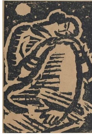
চিত্র ২: জয়নুল আবেদিন, চন্দ্রালোকে অনুধ্যায়ী ১৫ x ৯.৫ সেমি., লিনো খোদাই, ১৯৫০ দশক