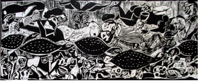
চিত্র ৬: কামরুল হাসান, রূপকল্প-৭৪, ৫৫ x ২০ সেমি., কাঠখোদাই, ১৯৭৪

এ সিরিজ আবার প্রমাণ করেছিলো তিনি কতোটা সমাজ সচেতন। স্বাধীনতার পরবর্তী কয়েক বছরের সামাজিক কলুষ তাঁকেও ব্যথিত হতাশ করে তুলেছিলো অনেকের মতো। ...সমাজ জীবনে রাজনীতিবিদ আমলাদের দৌরাভ্য নিষ্পেষিত জনগণের হতাশা, দুর্ভিক্ষ কবলিত মাতা শিশু এইসব হলো ‘ইমেজ-৭৪-এর’ বিষয়বস্তু। এখানে তিনি কর্তাদের মুখ ঐক্যেছিলেন পঁচা, শৃগাল, গিরগিটি, সাপের মতো। প্রশাসনিক মছুরতার প্রতীক হিসেবে এসেছিলো কচ্ছপ। প্রতিটি কাঠখোদাই মনের মধ্যে তুলে ধরে এক ধরনের জ্যান্ত বীভৎস চিত্র যা কামরুল হাসানের পূর্ববর্তী সব রোমান্টিক ছবির বিপরীত (মুনতাসীর, ১৯৯০, পৃ. ৮১)।