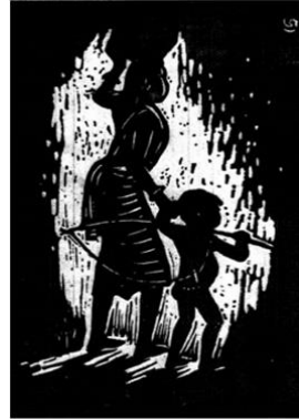
চিত্র ২: জয়নুল আবেদিন, সাঁওতাল মা ও শিশু , লিনোখোদাই, ১৯৪৫