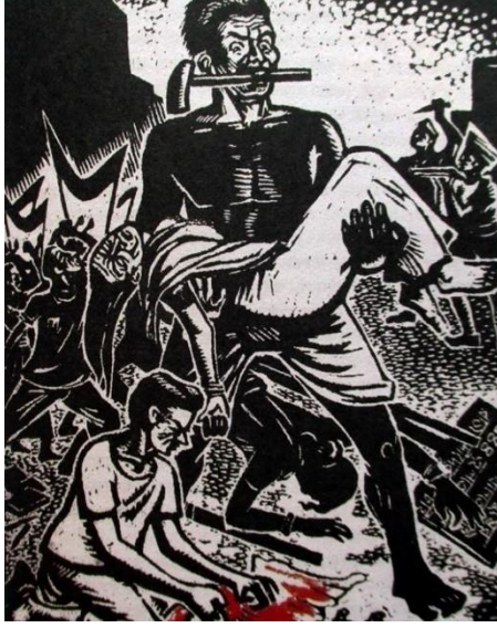
চিত্র ৩: কামরুল হাসান, পলিটিক্যাল প্রিজনার্স, কাঠ খোদাই, ১৯৪৬